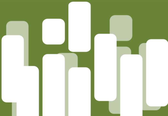
IMAGEN DE PROYECTO COLOCAR AQUI MEDIDA 780 X 620 PX

Paso para cambiar la imagen: hacer click derecho con el mouse sobre esta imagen verde, seleccionar la opción cambiar imagen y click en botón insertar . Luego seleccionar la imagen a utilizar en la medida indicada. De no ser posible luego se ajustará a la necesidad.