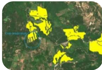
Cambio de las fincas bananeneras en La Guajira, Colombia-Agosto 2019.

De la teoría (antes de la presencia de la enfermedad) a la acción (reporte de la enfermedad el 11 de junio del 2019)