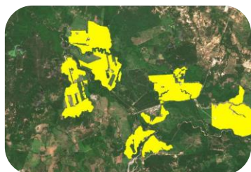
Cambio de las fincas bananeneras en La Guajira, Colombia-Junio 2019.