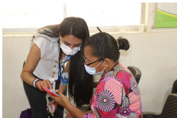
Imágen 6: Taller realizado en Colombia el 1 oct 2021