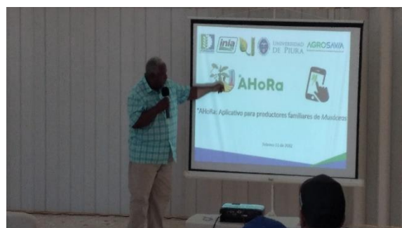
Imágen 3: Taller realizado en Republica Dominicana el 11 feb 2022