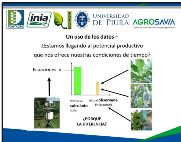
Imágen 9: Forma en que se deben interpretar los datos que arroja el aplicativo °AHoRa

Esta presentación explica brevemente la importancia del uso de tecnologías digitales en tiempo real, en el marco de la agricultura de precisión. Indica el avance tecnológico que han alcanzado las estaciones meteorológicas, dado que actualmente envían sus datos automáticamente y estos se almacenan digitalmente. Se resalta que, a partir del uso de datos como temperatura, radiación y evapotranspiración potencial, entre otros, se pueden llegar a interpretar o pronosticar el comportamiento o las necesidades del cultivo de banano, permitiendo así entender y responder a los requerimientos del cultivo, realizar un buen manejo de la productividad y aprovechar el potencial productivo.