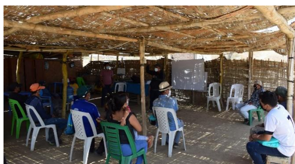
Imágen 5: Taller realizado en Perú el 17 feb 2022