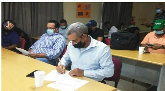
Imágen 2: Taller realizado en Republica Dominicana el 16 nov 2021