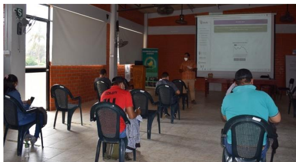
Imágen 4: Taller realizado en Perú el 25 feb 2022