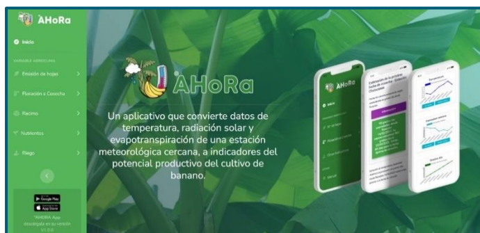
Imágen 10: Pantalla inicial del aplicativo °AHoRa

Mediante su presentación, se reveló el trabajo de la Universidad de Piura- UDEP en el diseño del aplicativo °AHoRa y se hizo una exposición del paso a paso para el funcionamiento del aplicativo. Paralelamente con la explicación de la estructura del aplicativo, todos los participantes ingresaron a la App desde su dispositivo Smartphone a través de un enlace previamente compartido, para que analizaran personalmente los datos que arroja la aplicación, como riego, rendimiento, número de hojas y período floración a cosecha. Así mismo se sugirió a los invitados revisar la versión Demo y emitir sus sugerencias en vista de mejorar el aplicativo.