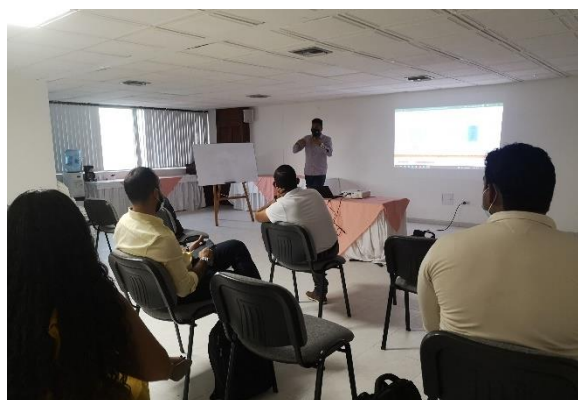
Imágen 7: Taller realizado en Colombia el 17 nov 2021