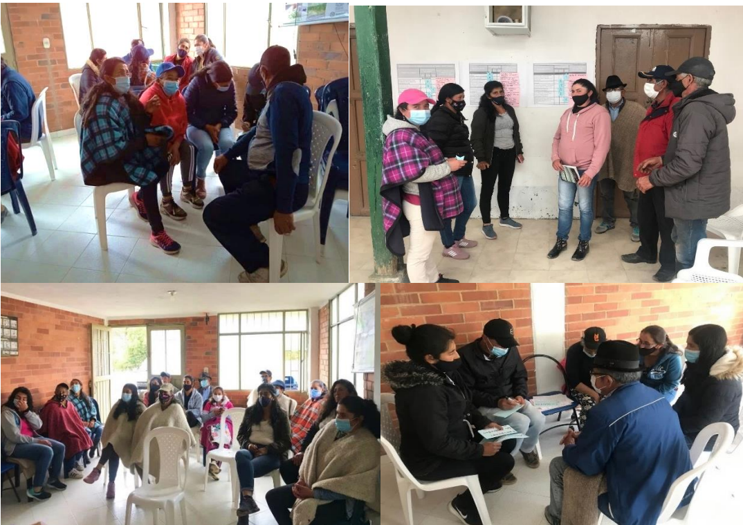
Fotografía 1: Talleres socio-organizacionales y socio-empresariales en la asociación Asoagroalzal

A continuación, se muestran algunas imágenes de los distintos talleres y/o actividades del plan de trabajo expuesto anteriormente, que se han llevado a cabo durante el desarrollo del proyecto con las distintas organizaciones de productores.