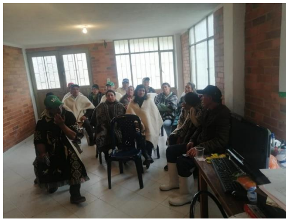
Fotografía 4. Pequeños productores colombianos durante un taller técnico y socio-empresarial en la asociación Asoagroalzal

La tabla 2 resume las actividades del plan de trabajo que se han desarrollado y los avances en la Asociación de pequeños productores “Asoagroalzal” del municipio de Carmen de Carupa en el departamento de Cundinamarca.