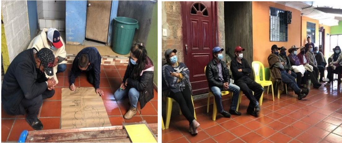
Fotografía 3: Talleres socio-organizacionales y socio-empresariales en la Cooperativa El Olivo