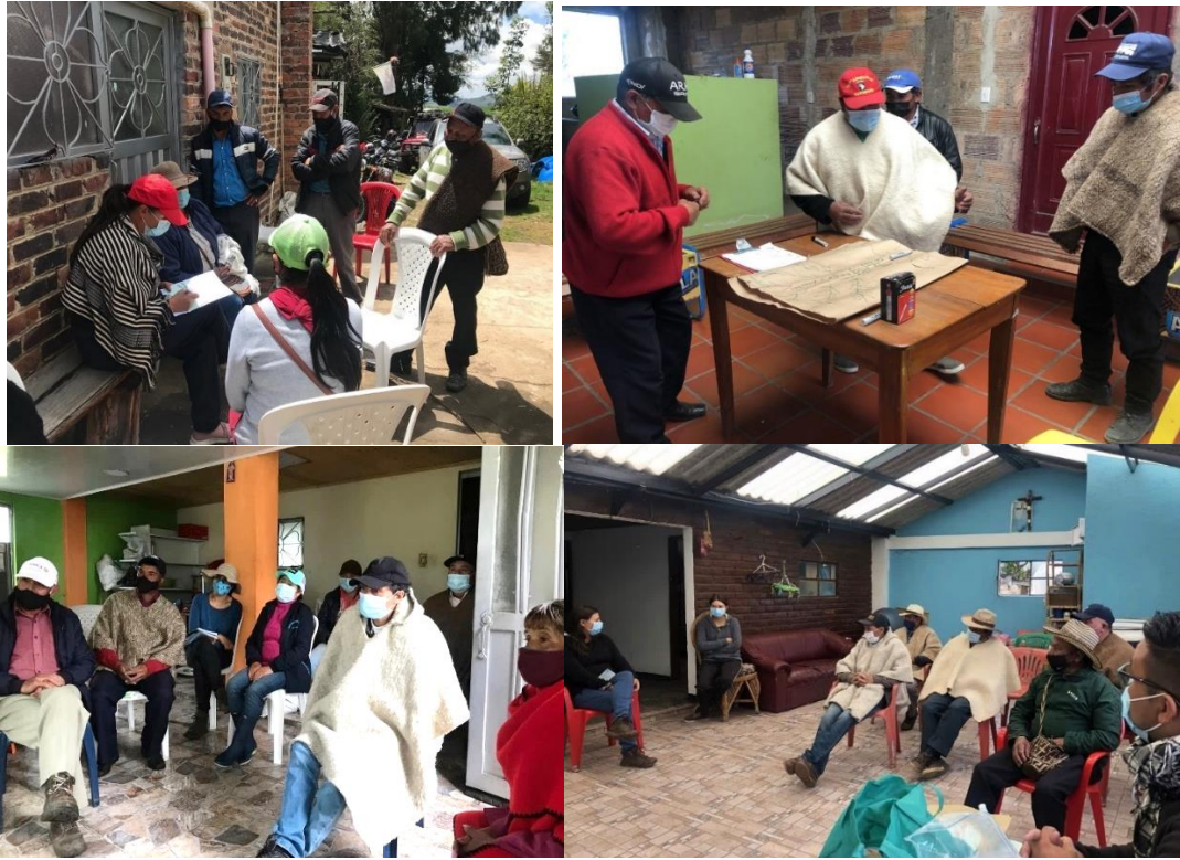
Fotografía2: Talleres socio-organizacionales y socio-empresariales en la Cooperativa Coinpacol