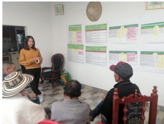
Fotograf6a 6. Peque6os productores colombianos durante un taller t6cnico y socio-empresarial en la cooperativa El Olivo.

La tabla 4 resume las actividades del plan de trabajo que se han desarrollado y los avances en la Asociación de pequeños productores “El Olivo” del municipio de C6mbita en el departamento de Boyac6.