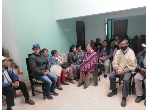
Fotografía 5. Pequeños productores colombianos durante un taller técnico y socio-empresarial en la cooperativa Coinpacol.