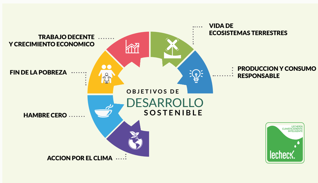
FIGURA 1: ODS asociados a las buenas prácticas incluidas en este documento

El alcance de este documento involucra todos los procesos y aspectos de la producción primaria de leche realizados en los establecimientos destinados a tal fin, incluyendo la etapa de almacenamiento y conservación de la leche luego del ordeño hasta la “tranquera” del establecimiento, no abarcando las actividades de transporte ni procesamiento de la leche, aunque ésta última se realice en el mismo establecimiento productor de leche.