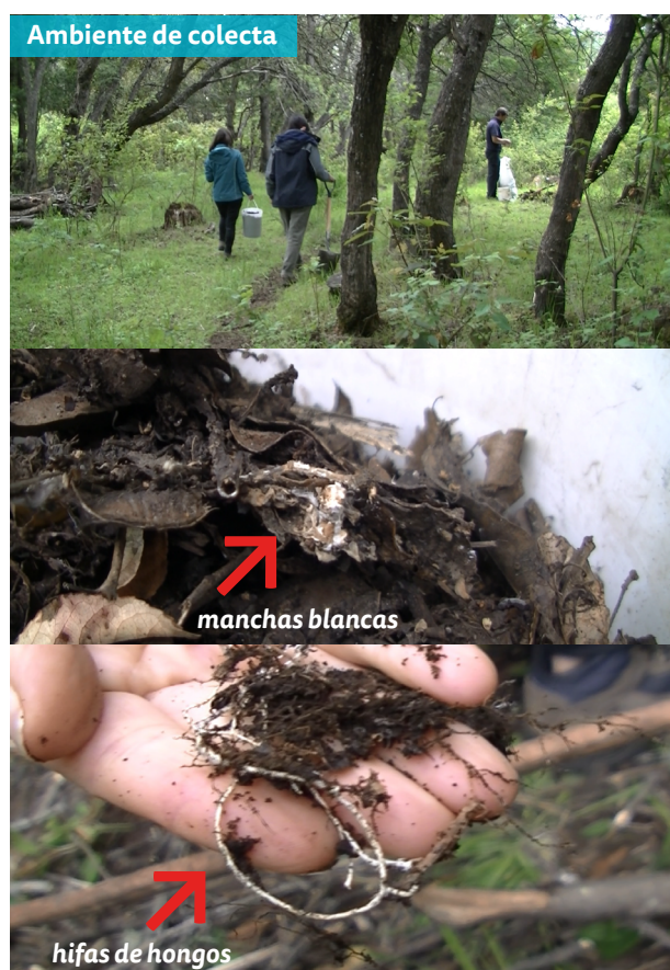
Figura 3. Colecta de microorganismos de montaña desde suelo / hojarasca de bosque. Fotos: Juan Pablo Duprez, taller AER El Bolsón, CEA N°3, Nov. 2019

Es mejor hacer la recolección en la primavera, ya que las condiciones ambientales (ej. humedad y temperatura) son más adecuadas para la reproducción y activación de los microorganismos de montaña.