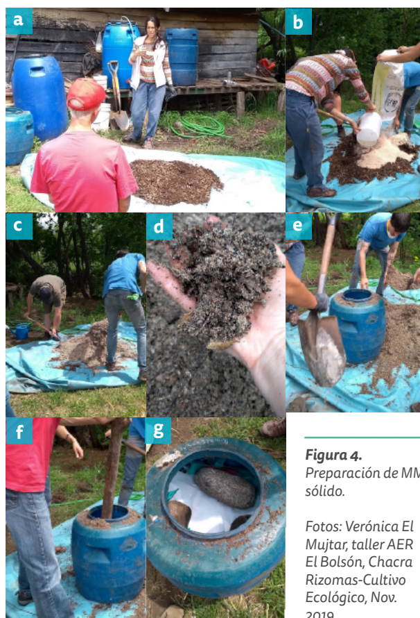
Figura 4. Preparación de MM sólido.

Introducir de a poco la mezcla en el tambor y apisonarla para sacar el aire retenido (Figura 4e-g). Una vez bien lleno y apisonado, tapar herméticamente para que se desarrolle la reproducción anaeróbica. Dejar descansar a la sombra por unos 30-50 días (según zona); luego se puede almacenar por 1 o 2 años. Cuando se necesite MM líquido se lo prepara usando MM sólido.