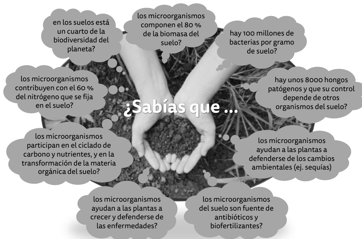
Figura 2. Importancia de los microorganismos del suelo.

Entender cómo funcionan los microorganismos es clave para su adecuada conservación y manejo, y para contribuir a la calidad y la fertilidad del suelo. Esto es especialmente importante en nuestra región donde las actividades de producción se encuentran inmersas en un entorno de ecosistemas boscosos que debemos preservar.