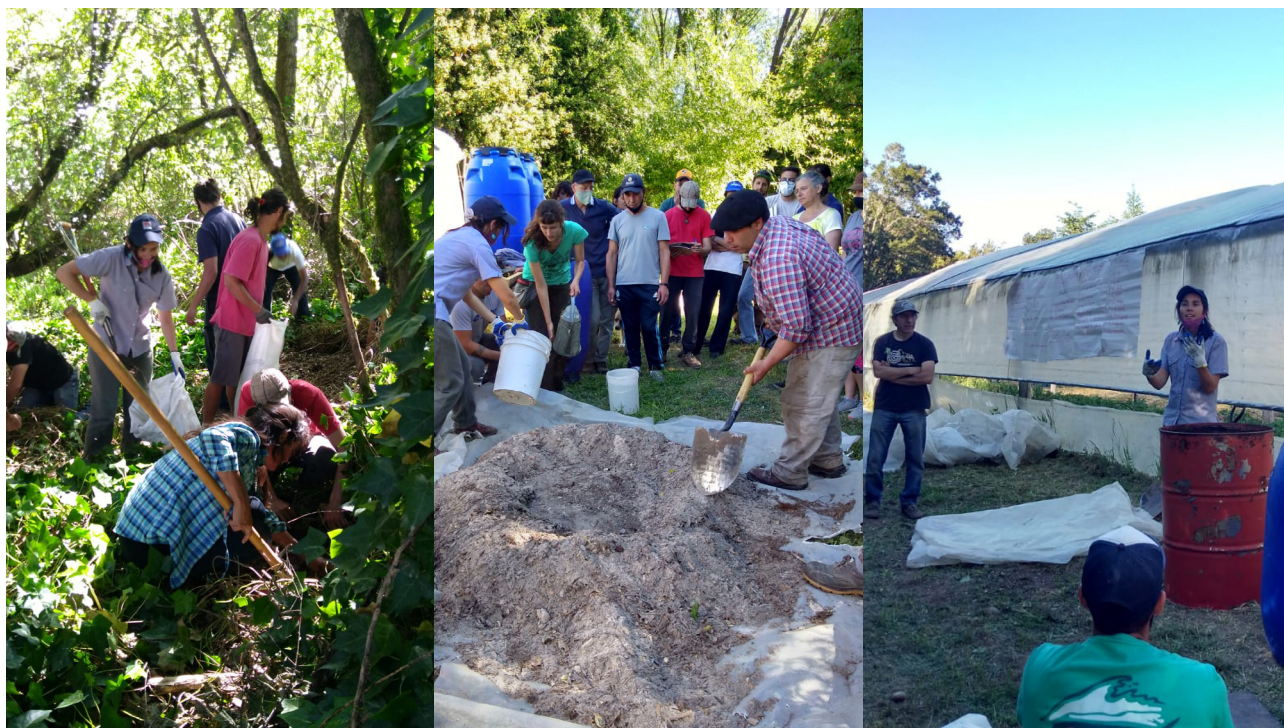
Figura 6. Taller de elaboración de biopreparados en Charcra La Confluencia, Lago Puelo, Chubut. Fotos: Leandro Sisón. Oct 2020.

La dilución de aplicación es de 1 kg de súper magro sólido por cada 100 litros de agua. Se mezcla bien y se deja disolver por unos 20 minutos agitando la mezcla. Luego se filtra con una tela de lienzo y se aplica al suelo con mochila o por fertirriego.