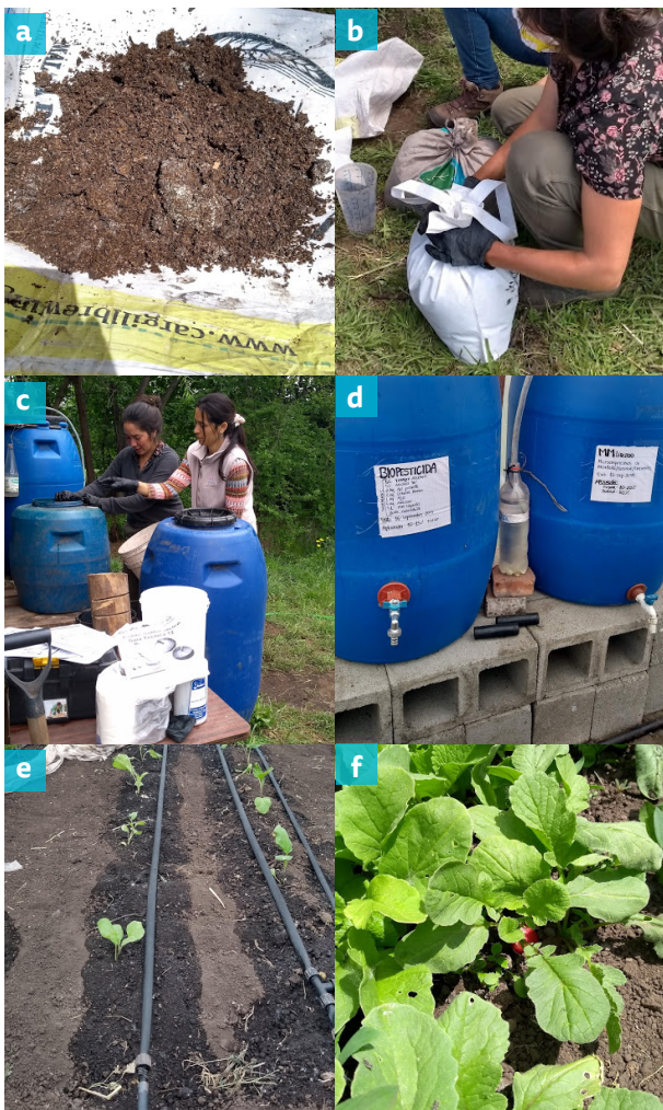
Figura 5. Preparación y uso de MM líquido a partir de MM sólido. Fotos: Verónica El Mujtar, taller AER El Bolsón, Chacra Rizomas-Cultivo Ecológico Nov. 2019.

Una vez listo el MM líquido se puede pasar la malla con MM sólido a otro tambor con azúcar y agua para preparar otros 200 litros de MM líquido.