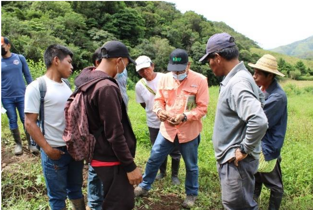
Fotografía 8. Capacitación Panamá. Reconocimiento de enfermedades en tubérculos de papa a la cosecha.