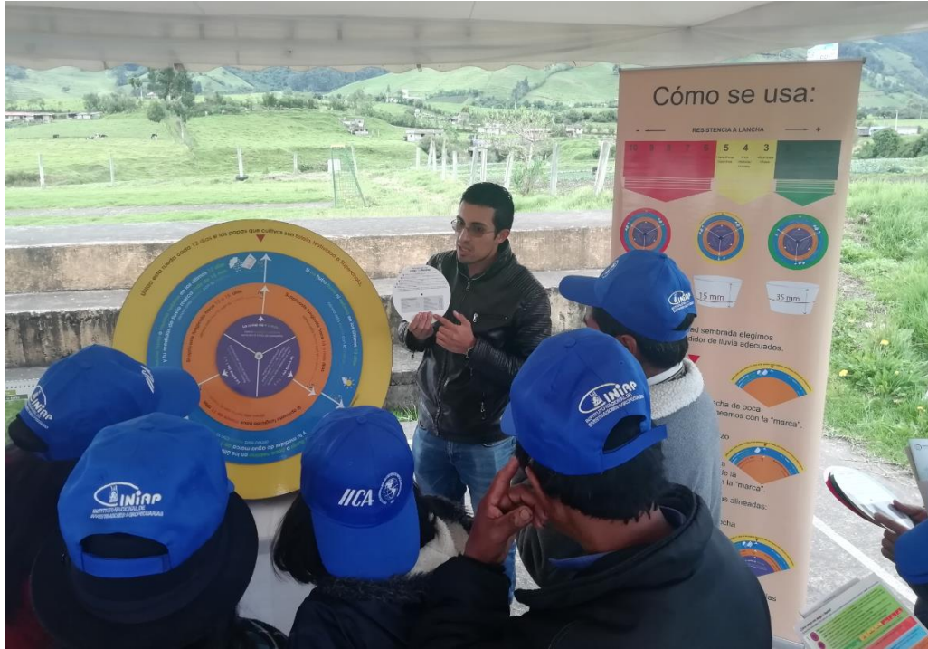
Fotografía 5. Capacitación Ecuador. Uso de Juego de ruedas SAD.