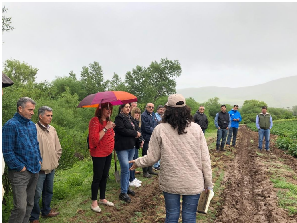
Fotografía 4. Actividad Argentina. Recorrida de los ensayos de alerta temprana.