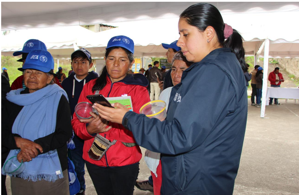
Fotografía 6. Capacitación Ecuador. Uso de Aplicación INIAP_PapaSAD SAD.