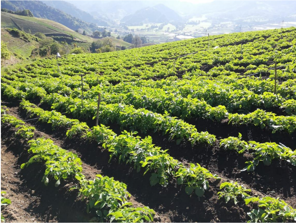
Fotografía 7. Parcelas de producción de papa en Cerro punta, Panamá.