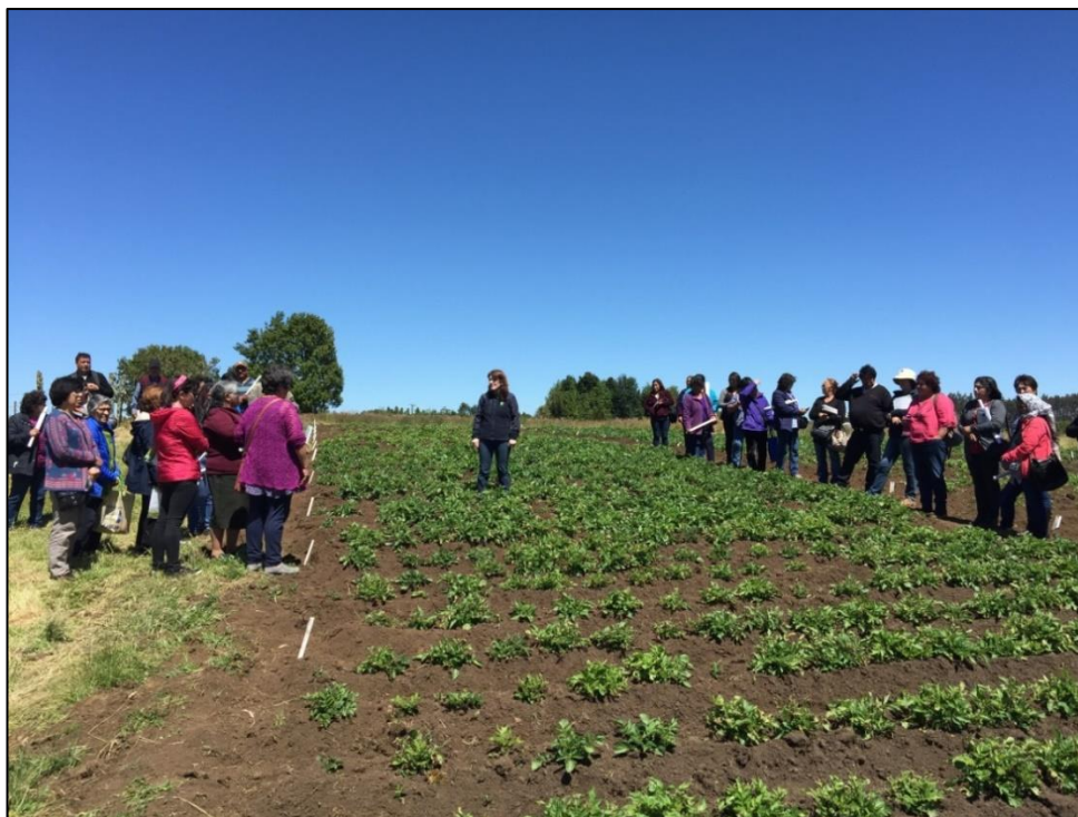
Fotografía 2. Día de Campo en Chile. Sanidad del cultivo de la papa.