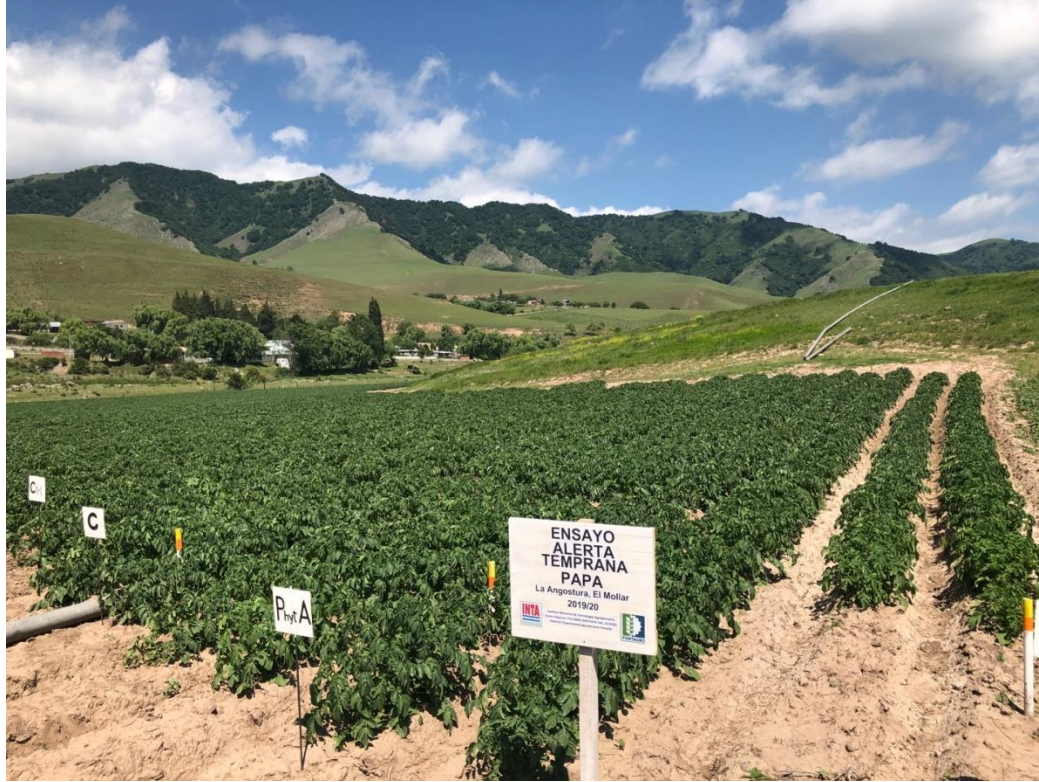
Fotografía 3. Actividad Argentina. Ensayo de validación de PhytoAlert en Tafí del Valle.