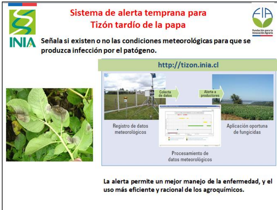
Fotografía 1. Seminario en Chile. Sistema de Alerta temprana para Tizón tardío.