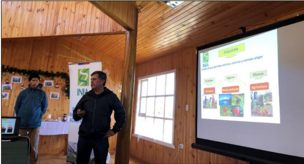
Fotografía 1. Taller Chile. Manejo de plaguicidas en papas.