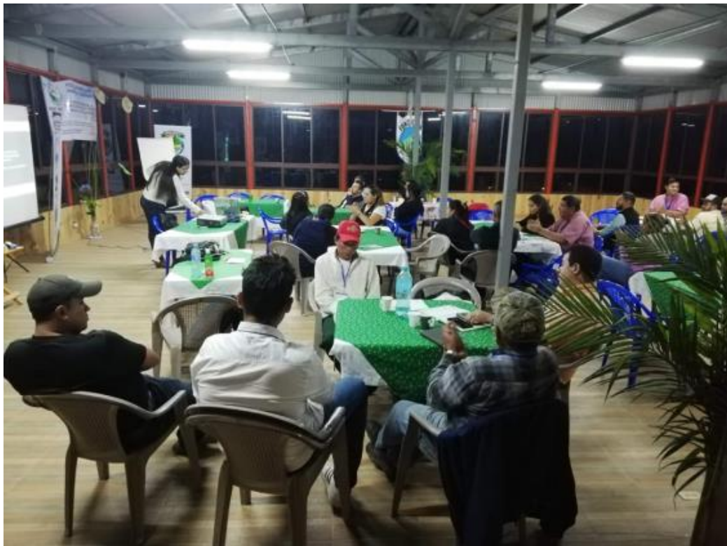
Fotografía 8. Taller Panamá. Taller Buenas prácticas agrícolas (BPA).