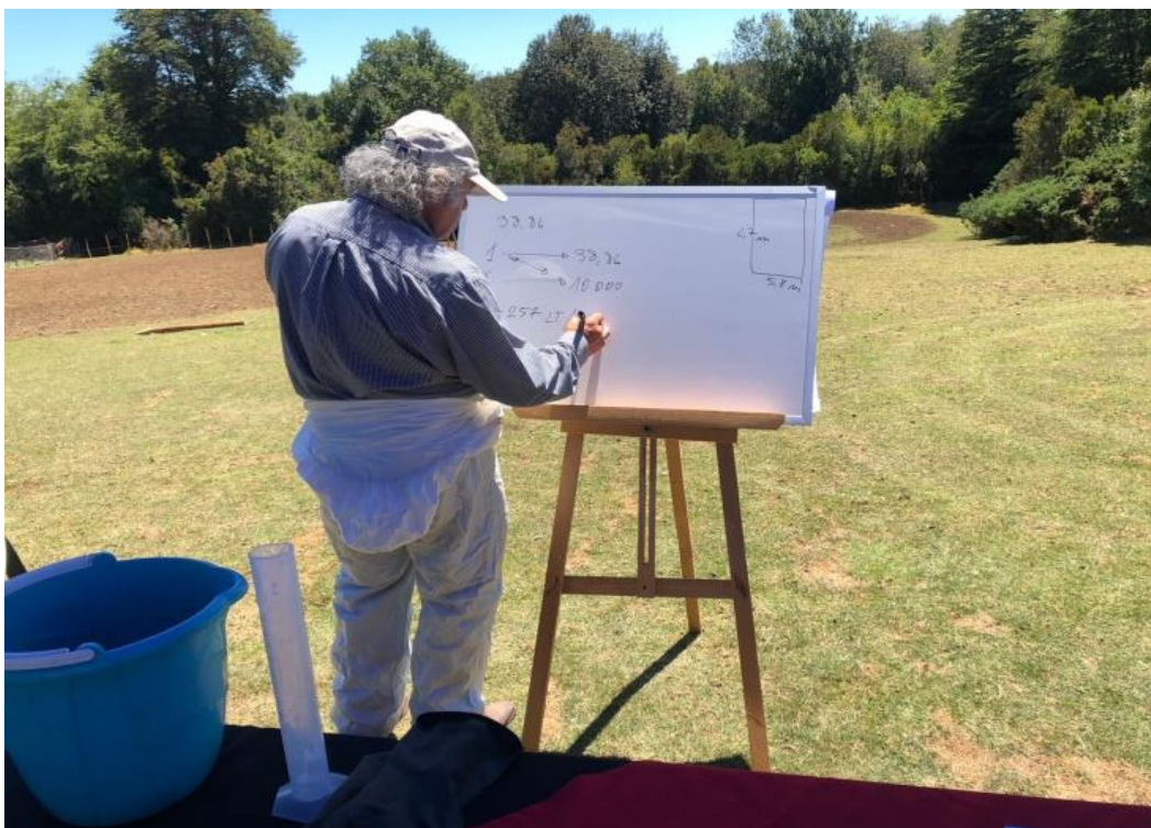
Fotografía 4. Taller Chile. Calibración de equipos pulverizadores y dosificación de productos, para un buen control de tizón tardío.