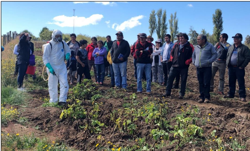
Fotografía 2. Taller Chile. Manejo de plaguicidas en papas.