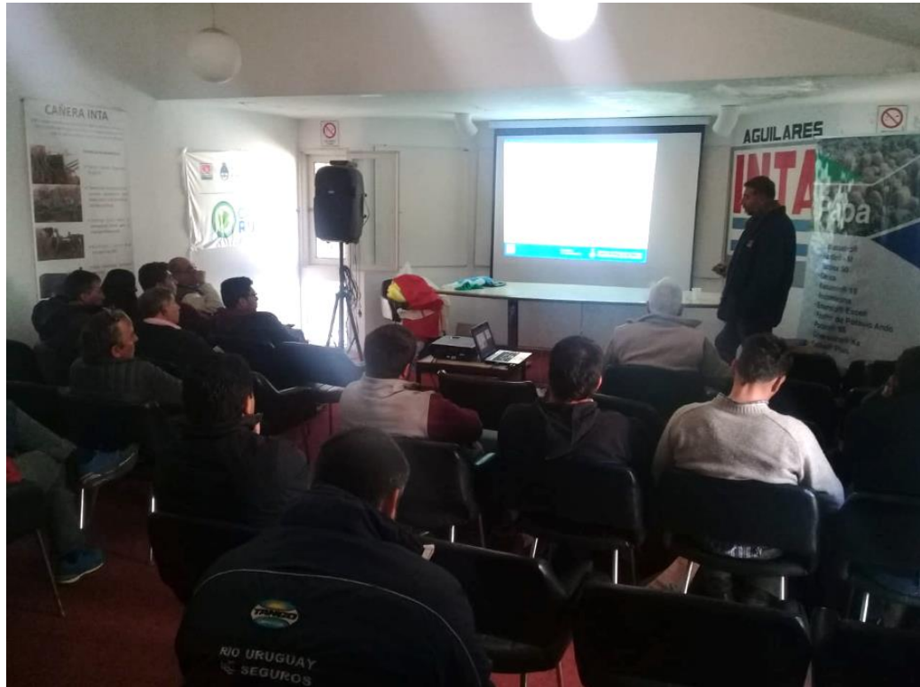
Fotografía 5. Taller Argentina. Capacitación teórica en BPA en Tucumán.