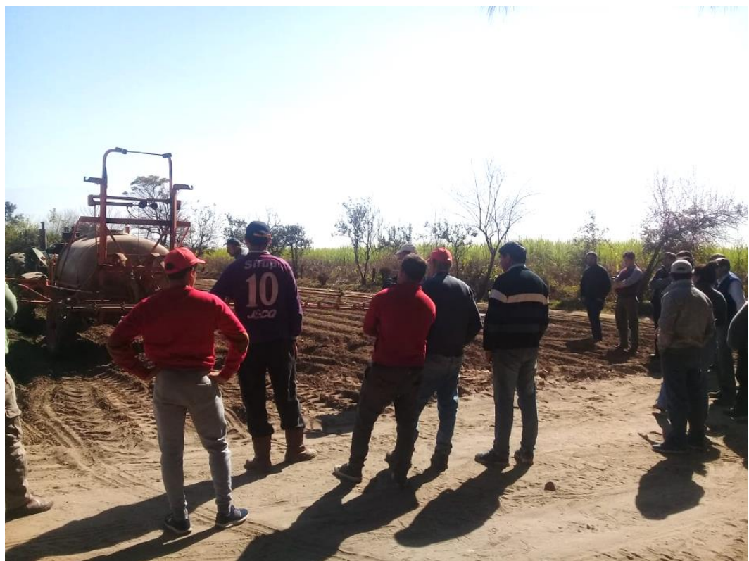
Fotografía 6. Taller Argentina. Capacitación práctica en BPA en Tucumán.