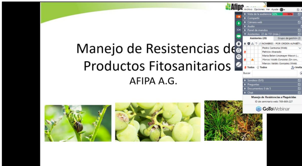
Fotografía 3. Taller Chile, Manejo de resistencia a plaguicidas. Modalidad Online.