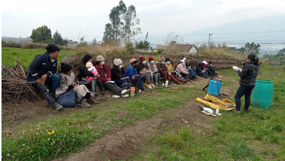
Fotografía 7. Taller Ecuador. Taller Uso seguro de agroquímicos y calibración de equipos de aplicación, Asociación Agricultores Santa Teresita – Tungurahua. 2022