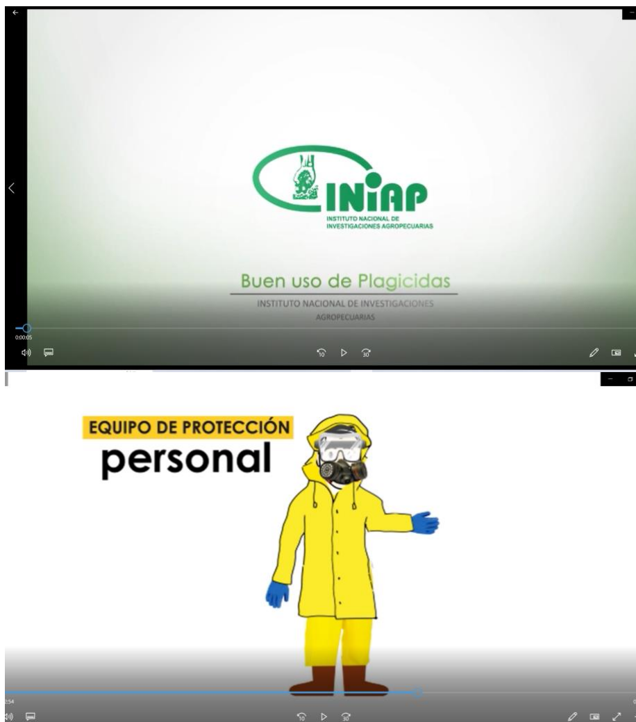
Figura 9. Video técnico “Manejo seguro de agroquímicos”. Ecuador

Descripción: video realizado por Cristina Tello del Instituto Nacional de Investigaciones Agropecuarias (INIAP) Ecuador, en este video se detalla el manejo adecuado de agroquímicos, desde el momento en que se adquieren, en su preparación, aplicación y posterior tratamiento y reciclado de los recipientes. Además de recomendaciones de uso seguro de agroquímicos (figura 9).