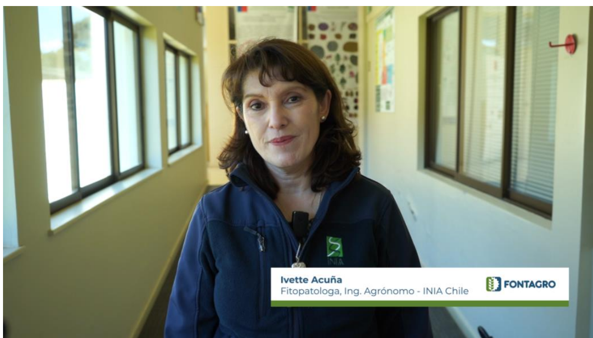
Figura 11. Video técnico “Manejo integrado y Buenas prácticas agrícolas” realizado por Chile