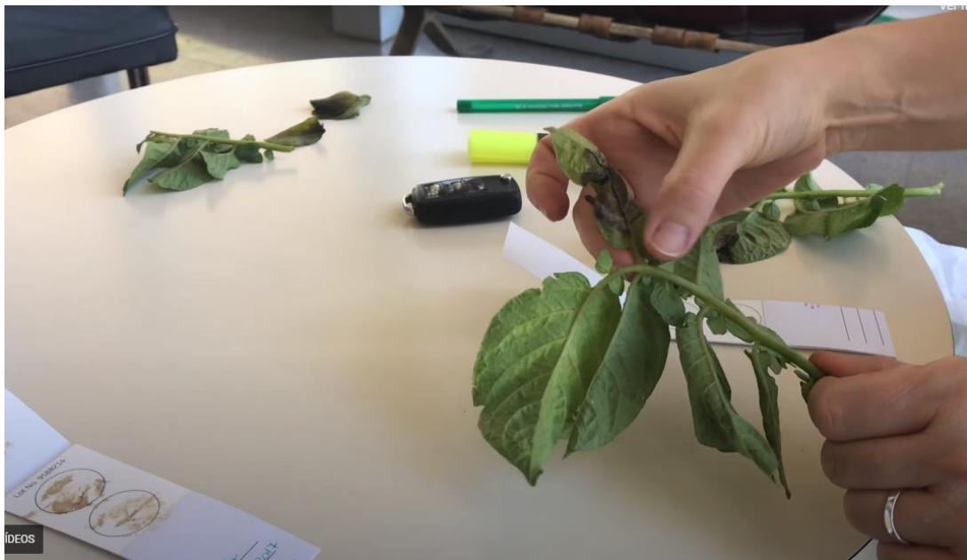
Figura 6. Video técnico sobre protocolo de muestreo en tarjetas FTA realizado por Argentina