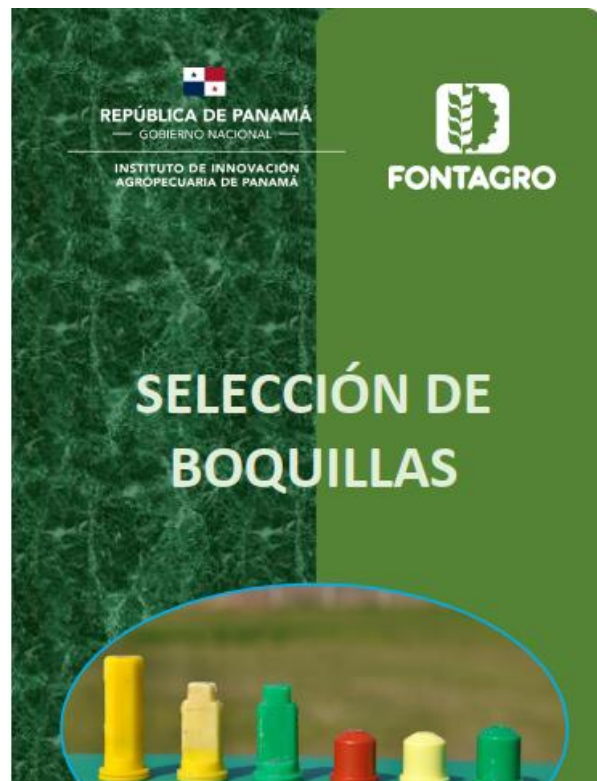
Figura 3. Ficha sobre selección de boquillas en equipos pulverizadores realizado por Panamá