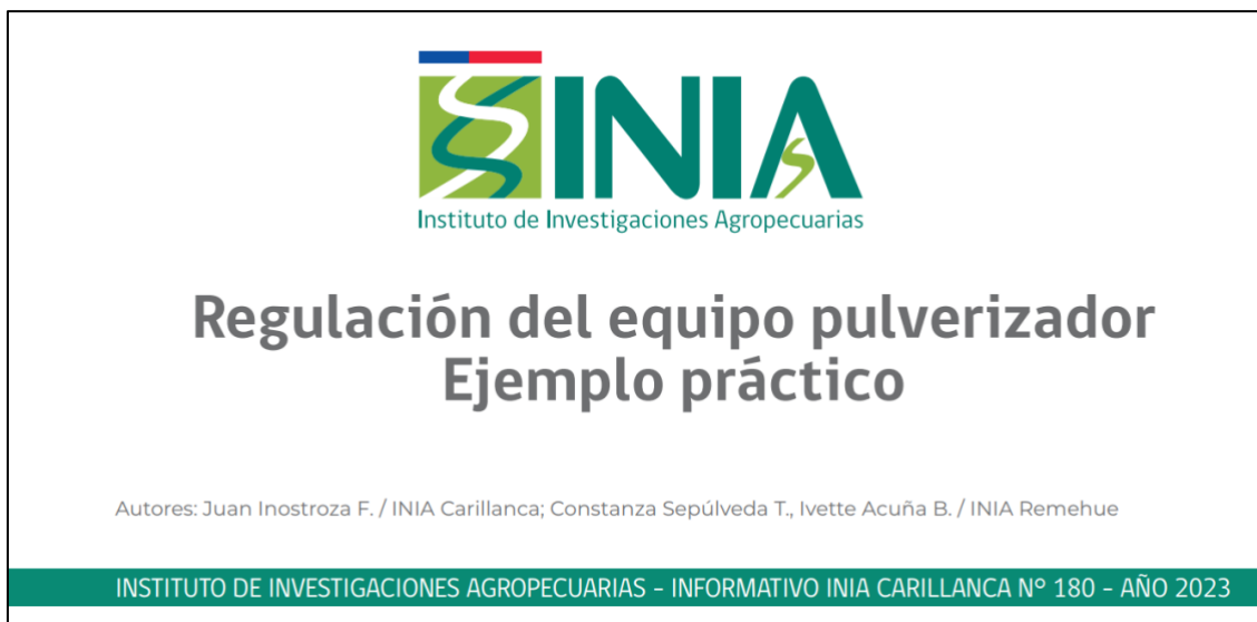
Figura 4. Informativo con ejemplo práctico sobre regulación de equipo pulverizador realizado por Chile.