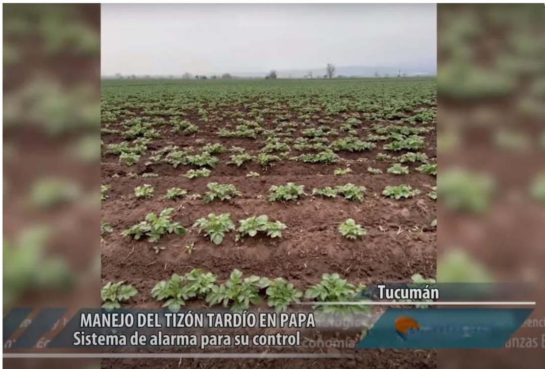
Figura 7. Video técnico uso PhytoAlert realizado por Argentina

Descripción: video realizado por el equipo técnico del Instituto Nacional de Tecnología Agropecuaria (INTA) Argentina, se muestra el uso de la herramienta para la toma de decisiones PhytoAlert, un sistema de alerta temprana para el manejo de Tizón tardío (figura 7). El sistema durante el ciclo de cultivo, emite alarmas por correo electrónico y SMS, con un pronóstico anticipado de riesgo de 48 horas, a fin de permitir la toma de decisiones de manejo oportunas para el control del Tizón. Junto a cada alarma se incluye una lista de fungicidas con distinto tipo de acción y eficiencia biológica a fin de facilitar la selección del fungicida más adecuado según la recomendación de la alarma.