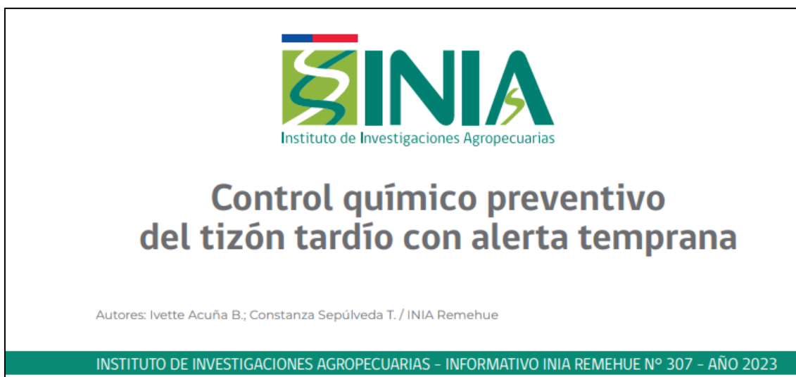
Figura 5. Informativo sobre control químico preventivo de Tizón tardío con uso de sistema de alerta realizado por Chile