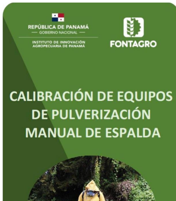
Figura 1. Ficha sobre calibración de equipos de pulverización manual de espalda. Panamá.