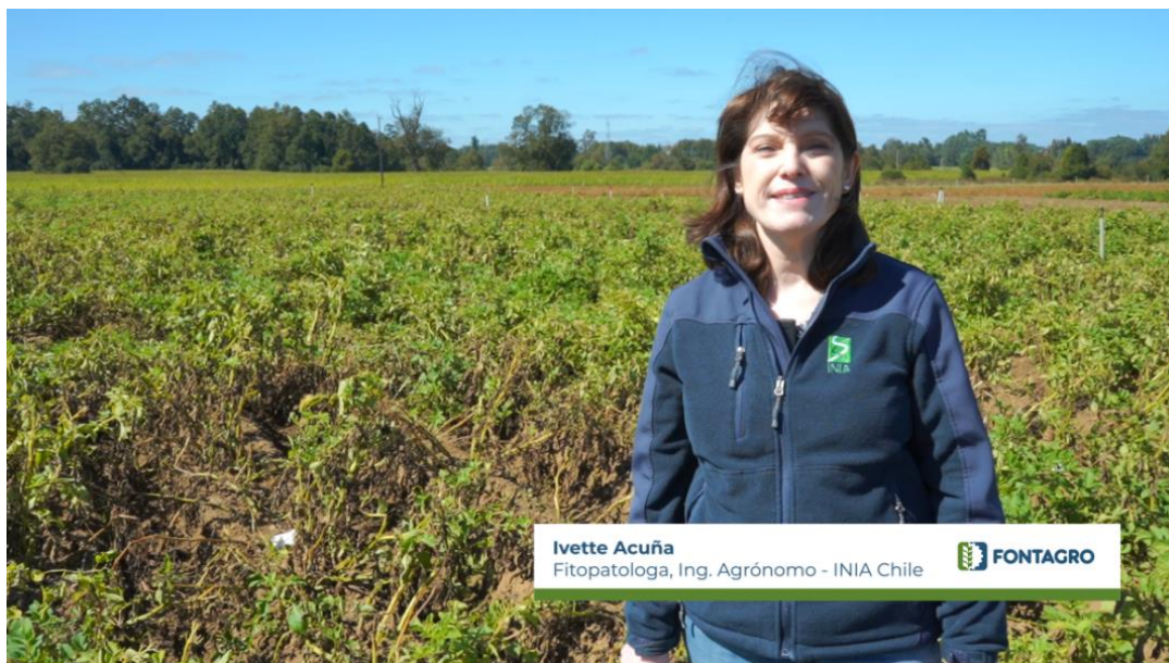
Figura 10. Video técnico “Epidemiología y sintomatología enfermedad” realizado por Chile