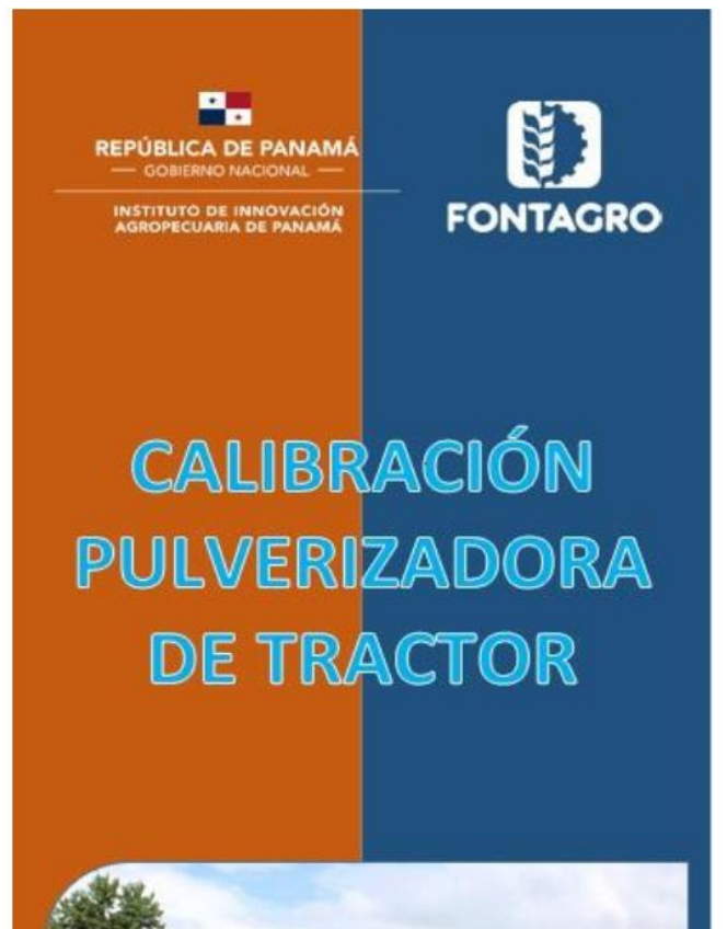
Figura 2. Ficha sobre calibración pulverizadora de tractor realizada por Panamá