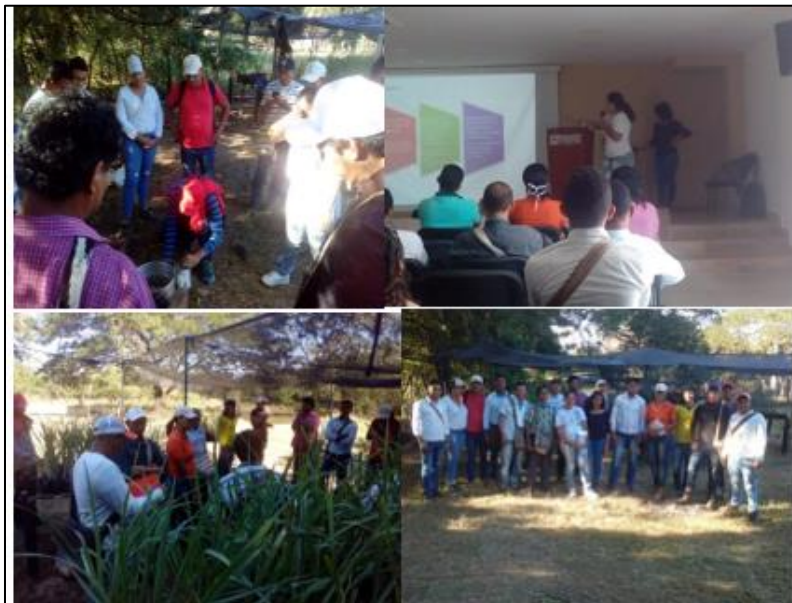
Figura 1. Actividades de capacitación en viverización de especies aromáticas

Lo anterior fue posible mediante los eventos de capacitación presencial, en los cuales se contó con la participación de 18 representantes de cinco organizaciones entre productores y académicos de la zona, con producción o interés en implementación de áreas de producción de especies aromáticas en vivero. De forma virtual se logró la vinculación de 57 productores en visualizaciones de contenido educativo digital vía web (figura 1).