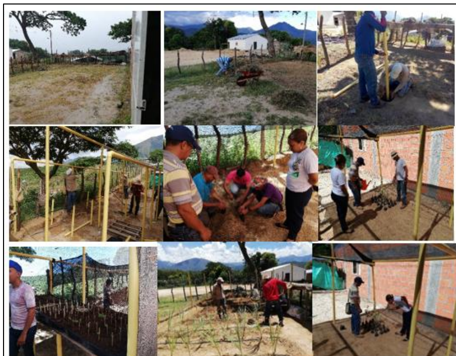
Figura 2. Actividades participativas de construcción del vivero para plantas aromáticas

Seguidamente se desarrollaron actividades correspondientes a la construcción participativa del vivero con la comunidad de productores Kankuamos y el equipo ejecutor del proyecto (figura 2).