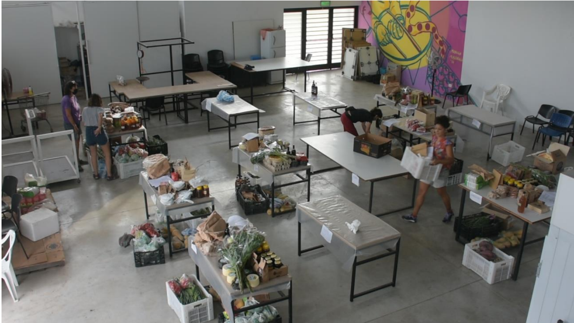
Ilustración 1. Galpón de acopio en el Centro Regional de Extensión Universitaria, Universidad Nacional de La Plata, Comercializadora La Justa, ciudad de La Plata, provincia de Buenos Aires, Argentina.

Como señalamos anteriormente, es necesario contar con una batería de instrumentos políticos, condiciones materiales, sociales y simbólicas (normativas, infraestructura, consumidores conscientes, valoraciones sociales) que acompañen la experiencia y la sostengan en el mercado. Esta perspectiva de intervención para el mejoramiento de las condiciones de producción y comercialización de los/as agricultores/as familiares reconoce la necesidad de transformar factores estructurales para sustentar las experiencias innovadoras. Esto supone un trabajo interinstitucional con diferentes instancias o niveles de gobierno (municipal, provincial y/o nacional), movilizandovoluntades políticas y saberes técnicos que realicen un abordaje sistémico. Este tipo de intervención interinstitucional es mucho más difícil y de más largo plazo, que el abordaje parcial o sectorial. A favor, destaca la posibilidad de promover transformaciones coherentes con las racionalidades y dotación de recursos de los/as agricultores/as familiares y, en consecuencia, factibles de ser apropiadas y sostenidas por ellos/as mismos/as.