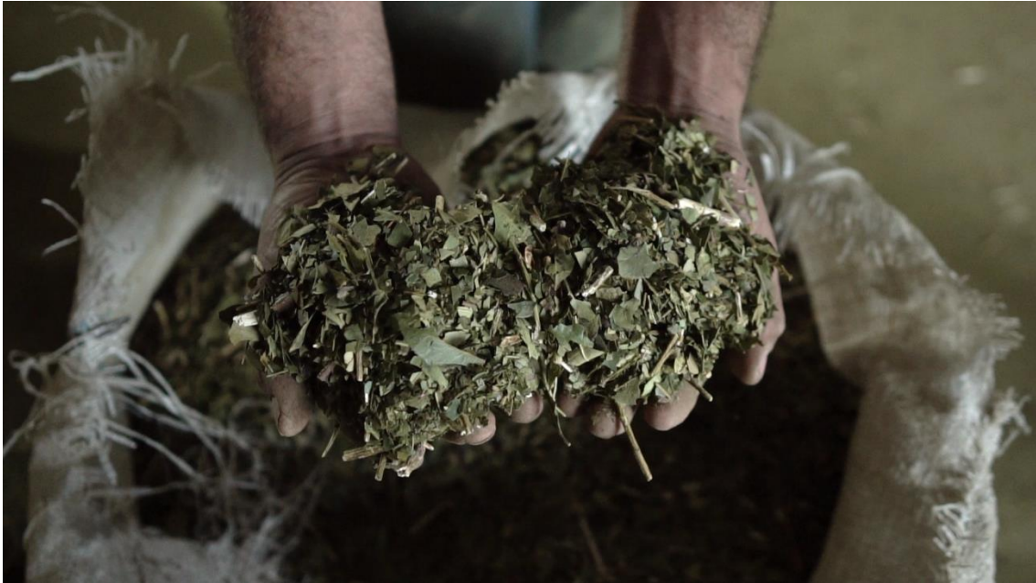
Ilustración 4. Yerba Mate canchada. Cooperativa Agropecuaria e Industrial Paraje Km. 1308, Consorcio Esperanza Yerbatera, provincia de Misiones, Argentina. Autor: Matias Barrientos