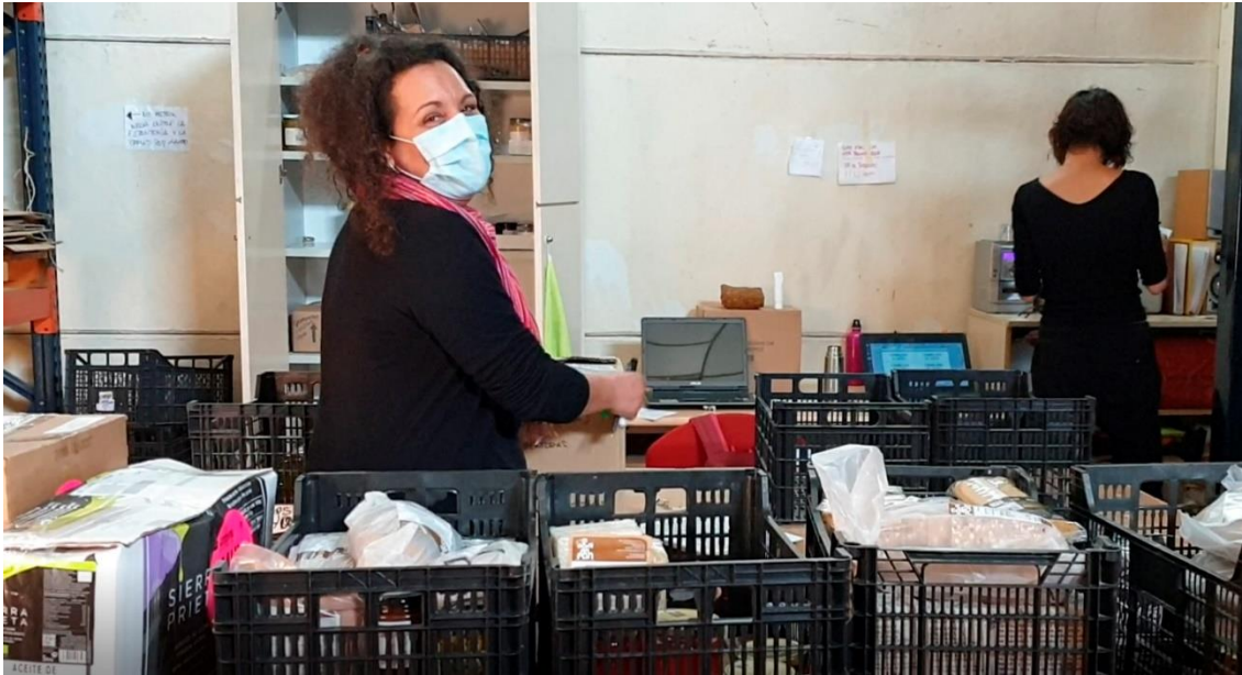
Ilustración 7. Integrantes de eComarca en la fase de piking. EComarca es una red para la distribución de productos ecológicos a grupos de consumo que surte a más de 20 grupos en la Comunidad de Madrid. Almacén de Madrid Km0, Madrid, España.

almacenaje, infraestructura, distribución, etc. compartiendo costos fijos, lo que posibilita dar el salto de escala (España).