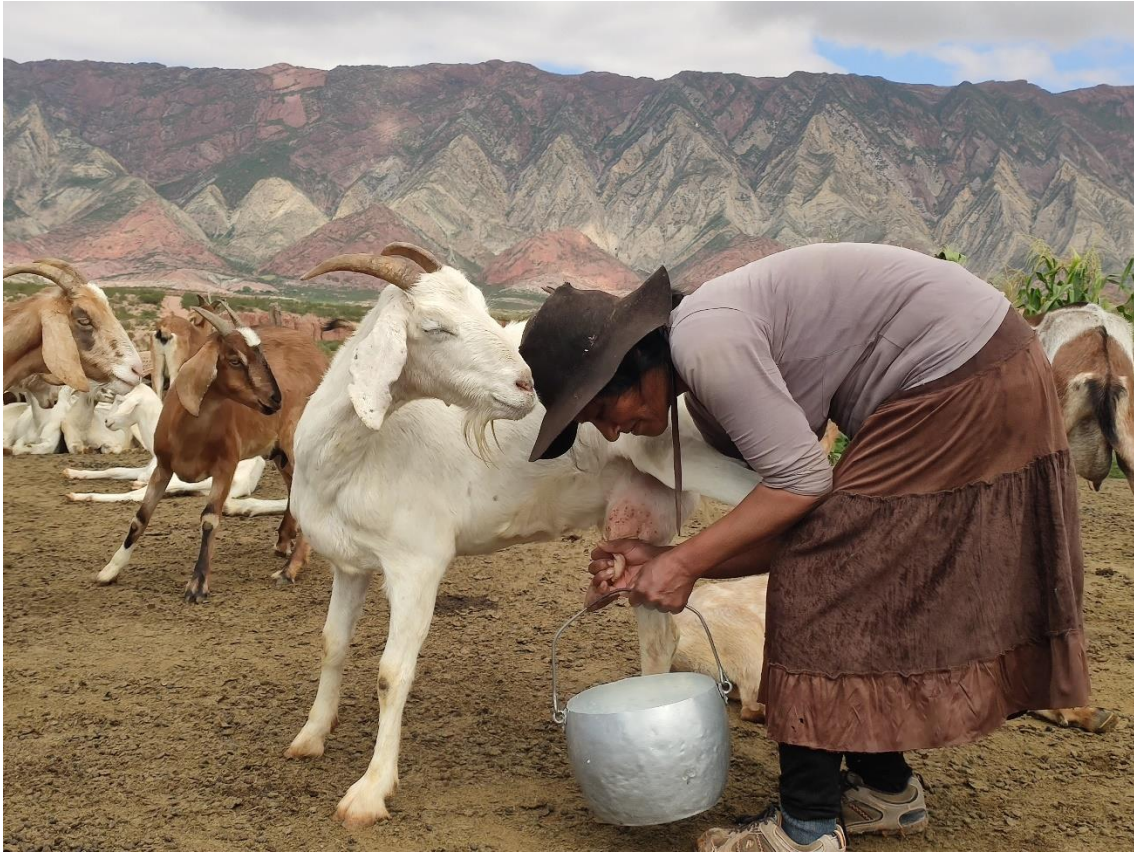
Ilustración 2. El cuidado de los animales y la producción quesera es una actividad principalmente femenina. La rutina diaria de la elaboradora incluye ordeñe a corral y posterior elaboración del queso. Amblayo, Provincia de Salta, Argentina. Autora: Ana Müller.

En muchos casos estudiados en el marco de este proyecto, la experiencia surge desde los actores institucionalizados (INTA, universidad, ex empleados estatales) que en diferentes grados articulan con los actores locales (AF preponderantemente). Esta articulación se potencia de manera positiva siempre y cuando las familias de la AF toman la actividad o la innovación como propia. En los casos donde siguen dependiendo de los agentes estatales como el proveedor de soluciones, se corre el riesgo de dejar sin efecto la innovación al cambiar el contexto de políticas de intervención. Los cambios abruptos en la dirección de las políticas de intervención a todo nivel (municipal, provincial o nacional), resultan una amenaza permanente para los procesos de desarrollo territorial y son un riesgo omnipresente en procesos organizativos impulsados y sostenidos por equipos estatales conducidos desde una única institución. En tal sentido, a la par de propender al fortalecimiento de las instancias organizativas de la agricultura familiar, deberían considerarse la institucionalización de instancias públicas paraestatales que permitan consolidar -y estabilizar- una gobernanza que integre, articule y otorgue estabilidad a las relaciones entre los actores que participan de la agricultura familiar, incluyendo a los organismos con competencia técnica. De ese modo, se estaría en condiciones de lograr acervos de conocimiento, su