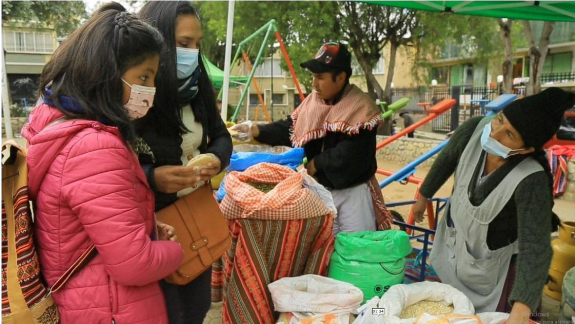
Ilustración 8. Puesto de venta de la Feria Ecotambo, Parque Rotari en el municipio Nuestra Señora de La Paz, Bolivia. Autor: Grover Cardozo.

Las experiencias analizadas en el marco del Proyecto, dan cuenta de la existencia de oportunidades para el fortalecimiento de la agricultura familiar a través de su participación en circuitos cortos de comercialización, la creación de estructuras logísticas cooperativas y la participación en mercados para productos diferenciados (orgánicos, agroecológicos, de cercanía, artesanales, entre otros).