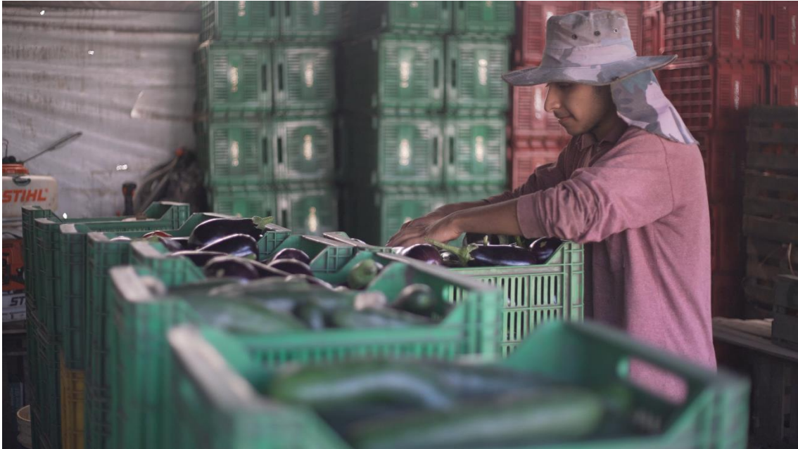
Ilustración 6. Acondicionamiento y armado de bolsones en el galón del emprendimiento Che verde, Mar del Plata, 'provincia de Buenos Aires, Argentina. Autor: Federico Sierra.

Es posible observar que las innovaciones emergen, con frecuencia, en contextos marcados por una intensa experiencia asociativa y/o gremial previas , a lo largo de la cual se generó un capital social en tanto relaciones de confianza, redes de relaciones y de reconocimiento mutuo, alianzas entre actores; y cultural en lo que hace a saberes y aprendizajes individuales y colectivos generados en la acción y sedimentados en las organizaciones de agricultores familiares.