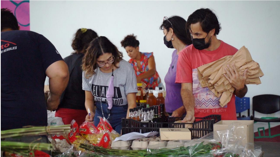
Ilustración 5. Preparación de pedidos para los nodos de la comercializadora La Justa. Salón de acopio del Centro Regional de Extensión Universitaria (CREU), Universidad Nacional de La Plata. Ciudad de La Plata, provincia de Buenos Aries, Argentina.

Las experiencias analizadas que se consolidan y sostienen en el tiempo son aquellas en que los productores y sus organizaciones construyen estrategias con creciente autonomía en la determinación de los precios y en la definición de las condiciones de venta . Las organizaciones de agricultores familiares y campesinos son actores centrales en el proceso de innovación y participan en cada una de sus fases. El involucramiento de los agricultores y agricultoras es el medio para que sus lógicas de producción y reproducción de la explotación familiar se impongan en el diseño de las estrategias de agregación de valor y comercialización.