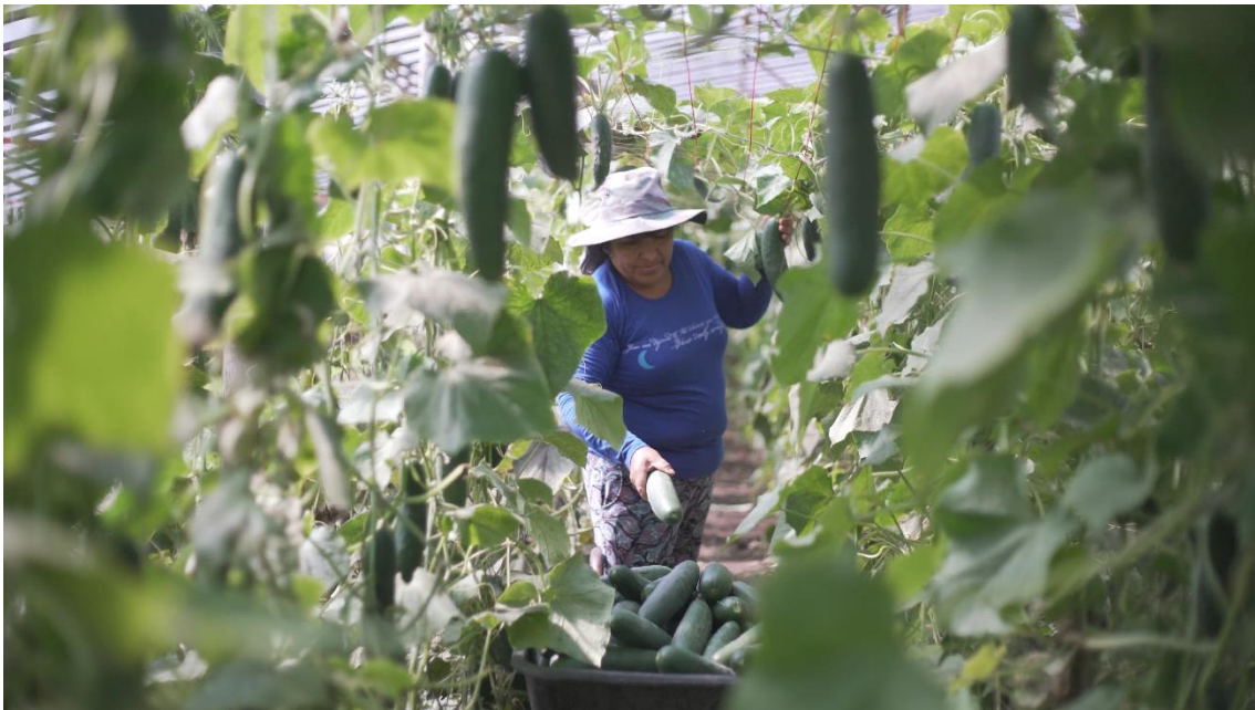
Ilustración 3. Productora agroecológica, proveedora a diferentes agrupaciones. Che Verde, Mar del Plata, provincia de Buenos Aires, Argentina. Autor: Federico Sierra

acumulación y reelaboración, propendiendo a saltos incrementales en las capacidades innovadoras de las políticas públicas, en condiciones de centralizar experiencias, producir conocimiento formal y tácito, así como construir un conocimiento técnico ligado a las demandas del sector.