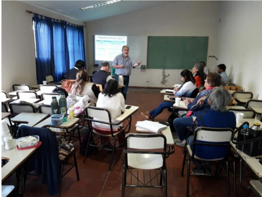
Foto 4. Reunión en la Facultad de Agronomía y Zootecnia de la UNT, septiembre 2018

En encuentros subsiguientes, el Consultor realizó una presentación del propósito del programa, los objetivos específicos del proyecto, las dimensiones y componentes que estructuran la propuesta y los lineamientos metodológicos diseñados con base en los TdR.