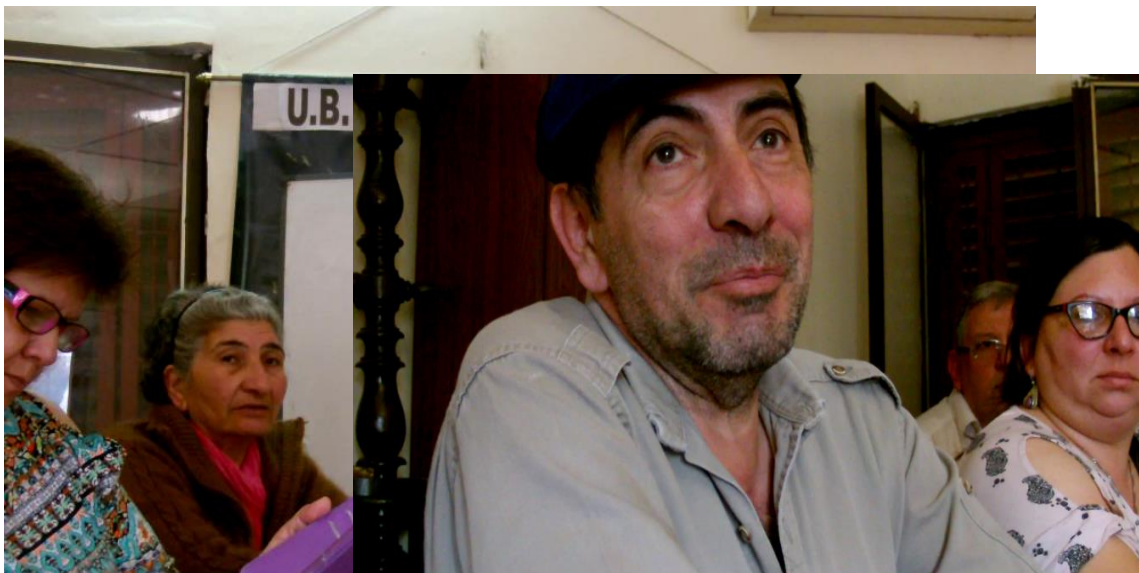
Foto 6. Grupos Focales de Feriantes y de Técnicos realizados en 2018

Otras técnicas cualitativas utilizadas fueron las reuniones de grupos focales mantenidas en el mes de octubre de 2019. Se realizó una para feriantes y otra para técnicos e informantes calificados.