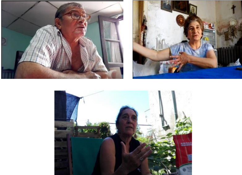
Foto 5. Entrevistas Piloto a Feriantes de la Feria de San Miguel de Tucumán (2018)

Durante la realización de estas primeras entrevistas se tomaron registros audiovisuales (fotos y grabación de voz). Para la selección de los casos a estudiar en profundidad se utilizó la técnica de construcción de una muestra según propósitos (Patton, 2002) o selección basada en criterios (Le Compte y Preissle, 1993). Las técnicas de entrevistas fueron complementadas con observación participante en las ediciones de feria entre fines de 2018 y 2019, donde también se realizaron videos mínimos, técnica aprendida durante el desarrollo de este Proyecto financiado por FONTAGRO. Estar en la feria y observar el movimiento de gente, el intercambio entre compradores y vendedores, así como la articulación con los técnicos de PH y los huerteros de la ROST, permitió analizar la red construida desde 2001 y que se fue consolidando a partir de la Feria de los Huerteros (2008).