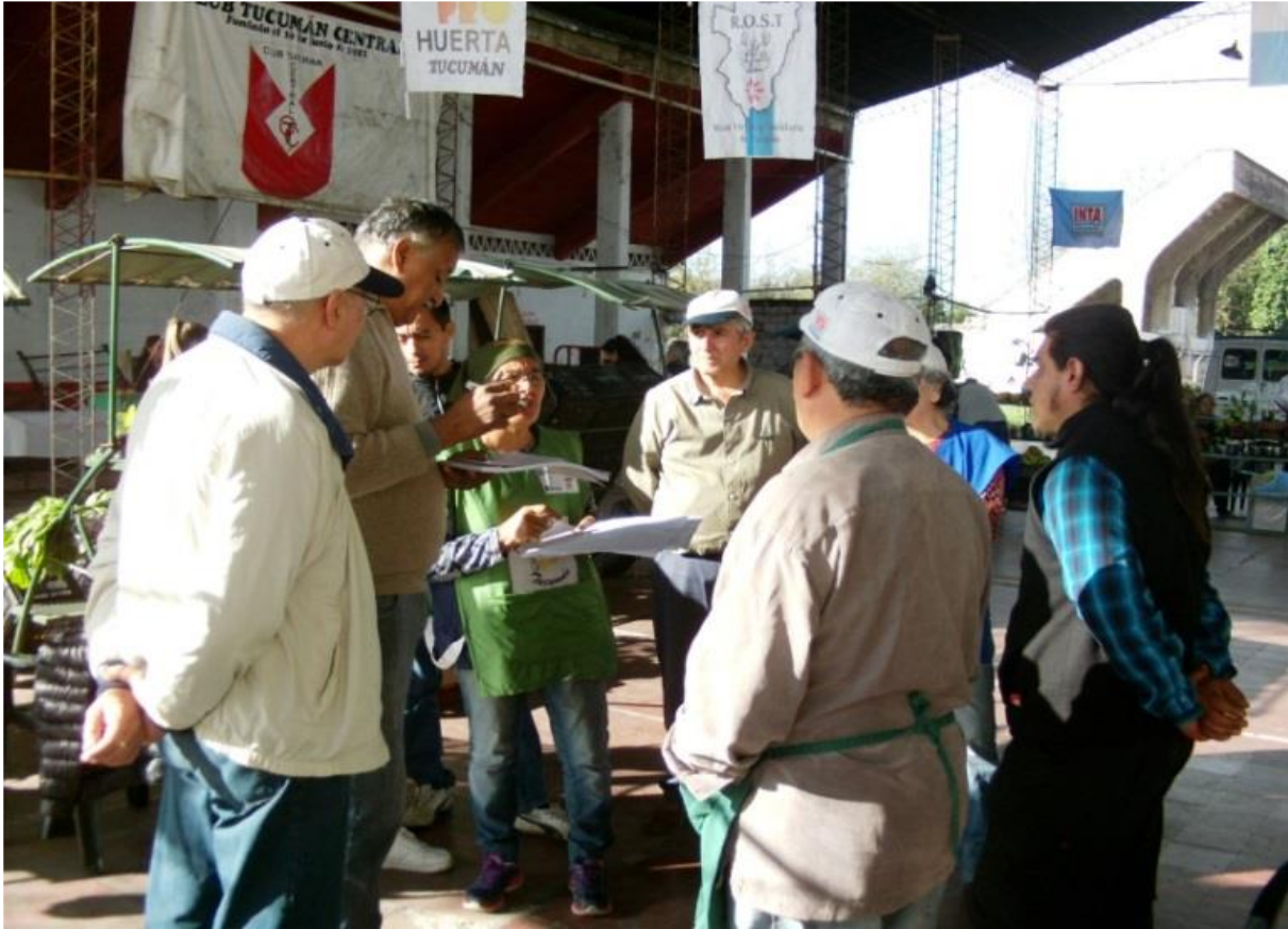
Foto 10. Concertación de Precios para la Feria del 12 de octubre 2019

La reunión de precios se hace en un ambiente distendido, respetando la opinión de los técnicos que a su vez preguntan a los huerteros si les parecen correctos esos precios. Para ellos, la venta directa no sólo les representa un ingreso extra, sino que es una oportunidad para relacionarse con otros productores y clientes, generando lazos de confianza y conocimientos nuevos. Una vez armados los puestos y confirmados los precios finales, se reúnen todos a desayunar en un espacio especial de la feria. A las 10.30 h se abren las puertas al público, sonando una campana. Esta función es responsabilidad del “arbitro”, que es una figura creada para hacer cumplir durante el desarrollo de la Feria el reglamento de la misma.