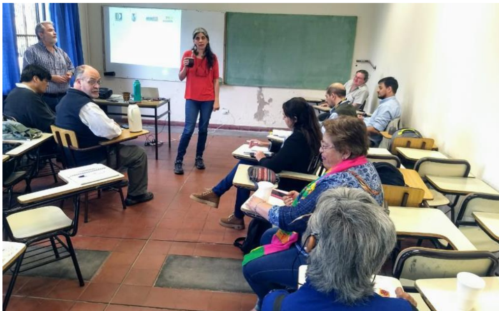
Foto 3: Reunión en la Facultad de Agronomía y Zootecnia de la UNT, septiembre 2018