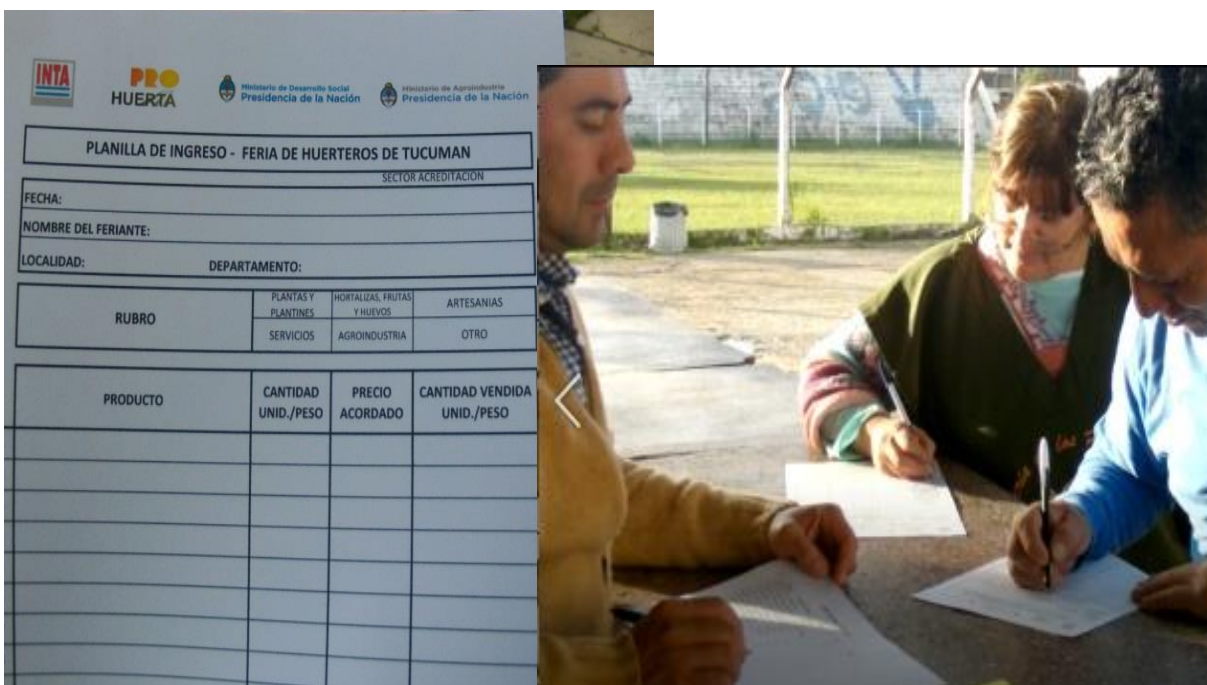
Foto 8. Planilla de Ingreso y Acreditación en la Feria (12 octubre 2019)

Desde las 8:30 h. está dispuesto un circuito de acreditación y control por el que deben transitar cada uno de los puesteros. En el sector de ingreso se verifica que los huerteros estén en un listado confeccionado previamente con la información que aporta el técnico de la zona. Cada feriante ingresa con una planilla donde registró la información de la producción que ha llevado, la cual debe coincidir con la información que aportó el técnico previamente y que está disponible en la mesa de acreditación. Además, el árbitro y/o los técnicos del Pro Huerta que se encuentran en el sector de acreditaciones, le preguntan al feriante si conoce el reglamento de la Feria y finalmente se verifica que sus productos estén correctamente acondicionados (en el caso de las frutas, verduras, huevos, plantas y plantines).