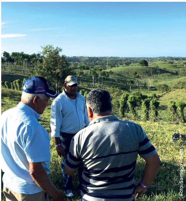
Figura 2 - Visita a finca lechera doble propósito en República Dominicana durante el Taller 'Modelación de estrategias de intensificación lechera' (10 - 13 de abril 2019).