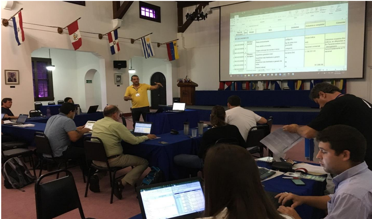
Imagen 3. Representantes de 9 países de Latinoamérica y el Caribe trabajando en la Clasificación de sistemas modales.