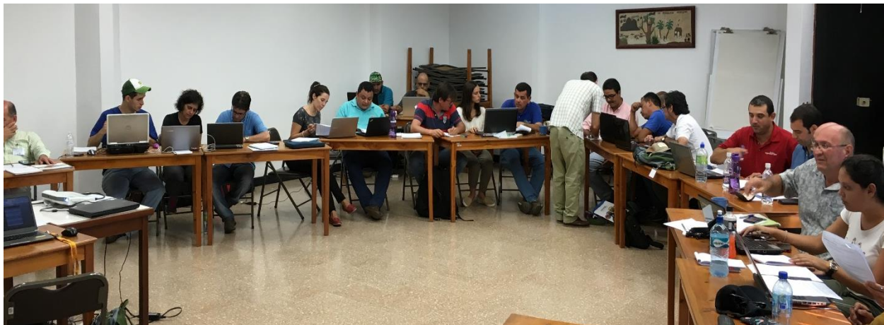
Imagen 1. Trabajo en equipo durante la definición de los descriptores de los sistemas de América Latina y el Caribe. Taller en metodologías de investigación en sistemas de producción ganadera adaptados al cambio climático, CATIE, 25 de abril al 6 de mayo de 2016.

Tras las presentaciones, los participantes trabajaron en grupos según la región (25 profesionales, 9 de América Central y el Caribe, 8 de la Zona Andina y 8 del Cono Sur, que provenían de 14 países) para alcanzar una primera definición consensuada de los descriptores necesarios para caracterizar los sistemas de producción lechera de la región (Imagen 1). Tras el taller, el grupo de trabajo interno del proyecto continuó trabajando en la definición de los descriptores. Finalmente se alcanzó una definición consensuada de 149 descriptores: 83 bio-económicos, 36 socio-organizacionales y 29 ambientales, los cuales constituirán la base para caracterizar los sistemas de producción lechera en la región.