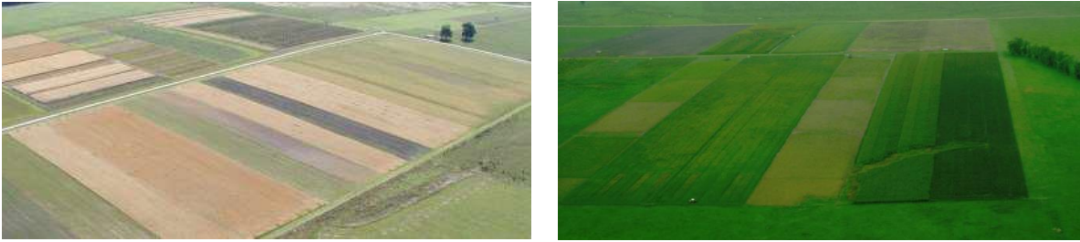
Figura 2. Vista aérea de dos de los experimentos de largo plazo ubicados en Uruguay, donde se evalúa el efecto de diferentes rotaciones de cultivos y pasturas sobre el contenido de carbono en el suelo. A la izquierda el experimento más antiguo de la región, iniciado en 1963 en INIA La Estanzuela. A la derecha el experimento de rotaciones de cultivos y pasturas que opera en siembra directa desde 1995 en INIA Treinta y Tres.

En el caso de los experimentos de largo plazo, la garantía de calidad científica sobre la información relevada se apoya en el diseño experimental y los muestreos ya realizados a lo largo del tiempo. Sin embargo, en el caso de los relevamientos de campo regionales se requiere de una estrategia de muestreo (disposición y número de sitios, y número de muestras/sitio) que permita detectar con un determinado nivel de certeza cambios en el stock de COS.